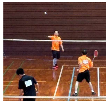
▲ 兄弟対決はやりにくいです