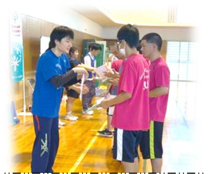
▲表彰状授与（学生さん達からアスリート全員へ）

体育館を4つに区切りゲーム（風船バレー・ミニサッカー・ペットボトルボウリング・バドミントン・しっぽ取り鬼ごっこ・靴下玉入れ）をアスリート達と聖カタリナ大学の先生・学生さん達と一緒にゲームを行いました。