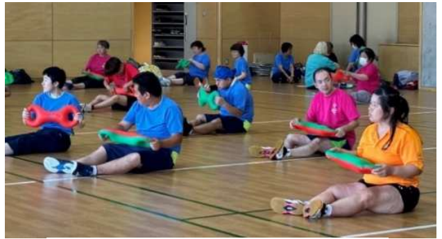
⇩ 座ったままで行う3B体操です。