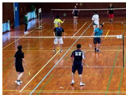
▲ 試合後ボランティアの高校生とユニファイドでダブルスの試合を行いました。